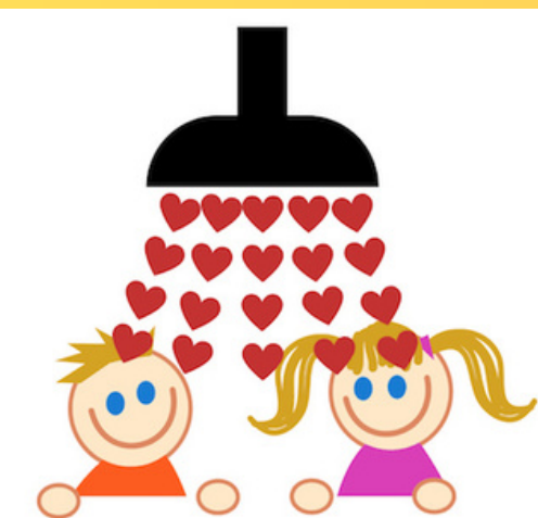
La douche chaude