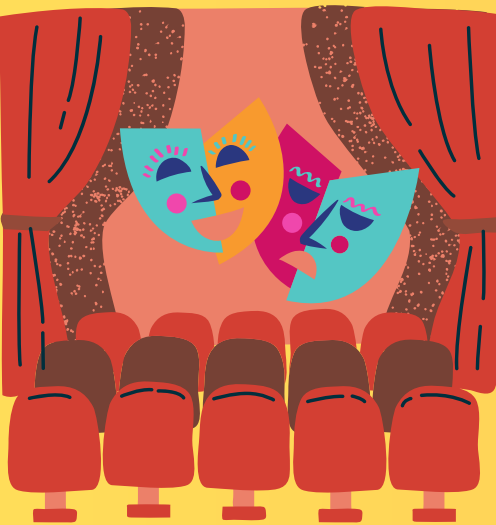
Petits rôles, et grands coeurs