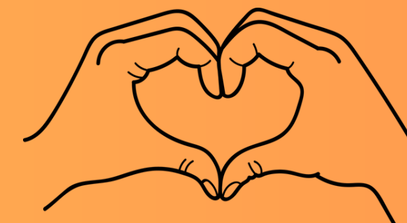
Voyage au coeur des autres